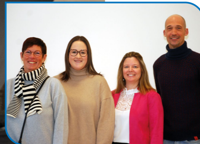
Zorgcoördinatoren eerste graad

Wie een zorgvraag indient bij inschrijving wordt uitgenodigd voor een gesprek om samen de noden van de leerling voor de start van het schooljaar in kaart te brengen.