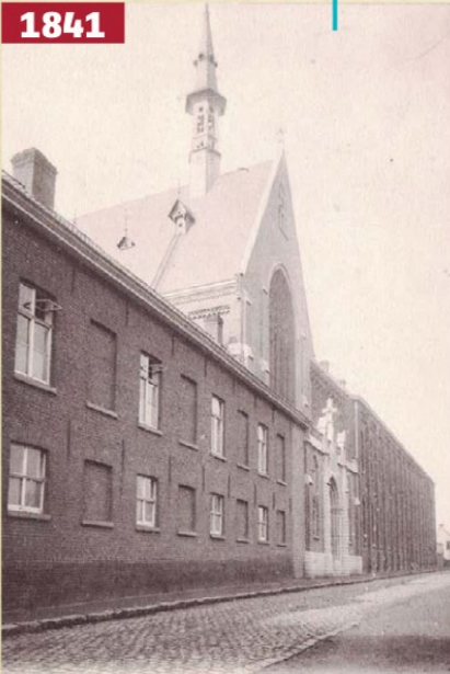
Heule Pensionnat des Soeurs de Charité. Illustration de l'école des sœurs de charité, et de leur habit - Son Vierge dans les études.

Oprichting 'Le Pensionnat des Soeurs de Charité de Heule'. Het eerste pensionaat bevond zich links naast de kapelingang.