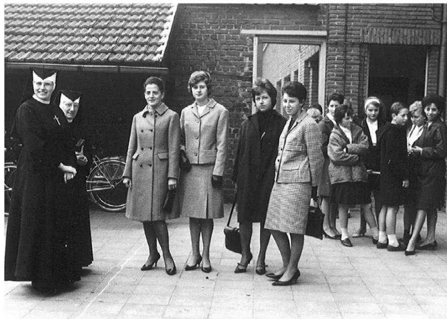
De zusters en enkele lekenleraresen in het tso/bso in 1963.